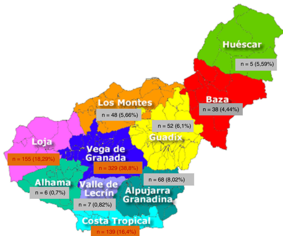
Figura 1 – Pacientes nacidos en Granada con PQRAD en los que se conoce la comarca de nacimiento a 31 de diciembre de 2016 (n = 847).