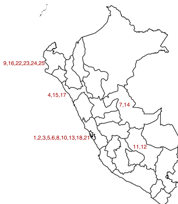
Figura 1 – Mapa de la ubicación de los hospitales que participaron en el estudio.

Para la ejecución del estudio se solicitó el permiso respectivo a cada hospital. Una vez obtenidos los permisos, se realizó la encuesta en cada una de las sedes hospitalarias, que fueron instituciones de los diferentes departamentos del Perú,