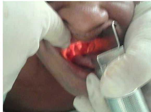
Figura 6 – Laringoscopia e intubación en prono.