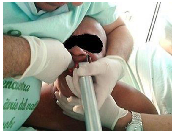
Figura 5 – Maniobra de intubación en prono.