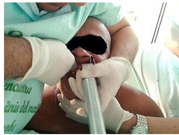
Figura 5 – Maniobra de intubación en prono.