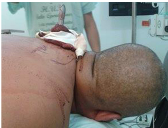
Figura 1 – Paciente en posición prono con cuchillo clavado en columna torácica.

Los estudios imagenológicos con tomografía computarizada de tórax (fig. 2) fueron realizados en PP. Se descartó neumotórax y se estableció la posición exacta de la hoja del