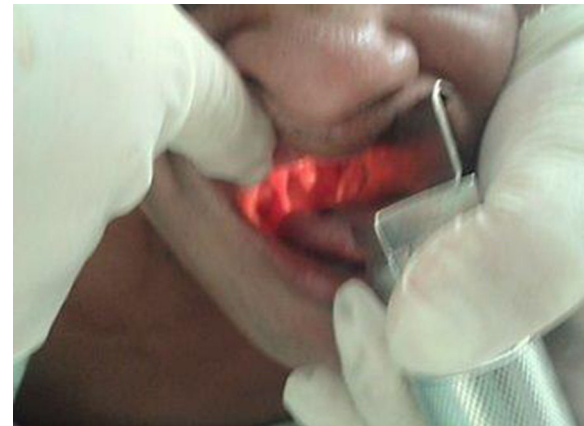
Figura 6 – Laringoscopia e intubación en prono.