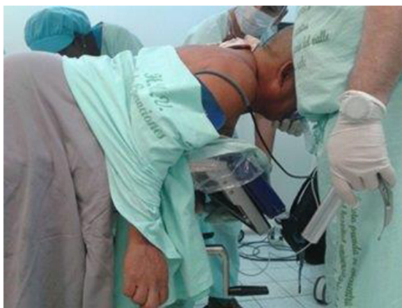
Figura 3 – Preoxigenación del paciente en posición prono.