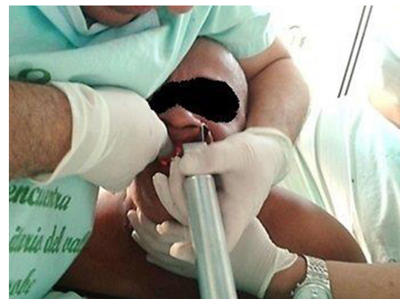
Figura 5 – Maniobra de intubación en prono.