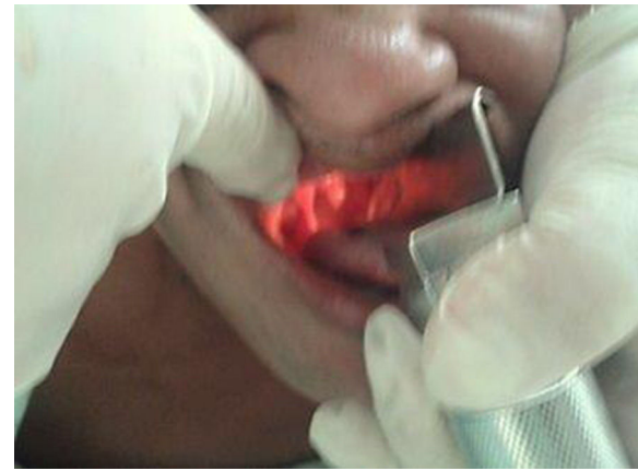
Figura 6 – Laringoscopia e intubación en prono.