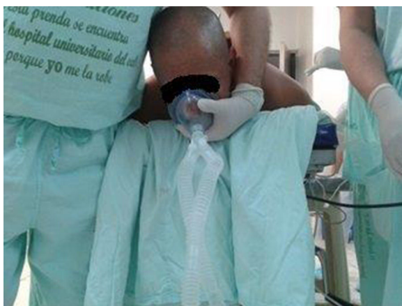
Figura 4 – Posicionamiento del anesthesiólogo para intubación en prono.