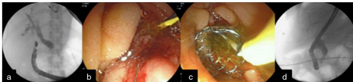
Figura 2 a) Punción guiada por el USE de la vía biliar con apoyo fluoroscópico y avance de guía hacia duodeno; b) Técnica de «Rendez-vous» y canulación de la vía biliar; c) Colocación de prótesis metálica biliar, y d) Visión fluoroscópica de la colocación de la endoprótesis biliar metálica autoexpandible.

introdujo la guía anterógradamente hacia dirección ampular hasta colocarla en la luz intestinal. Se introdujo duodenoscopio y se realizó la canulación retrógrada adyacente a la guía con esfinterotomo. Se realizó esfinterotomía corta (5 mm) y colocación de endoprótesis biliar WallFlex® cubierta de 10 × 60 mm con salida de bilis por la misma (fig. 2). La paciente fue egresada a las 24 h a domicilio sin datos de complicaciones u obstrucción biliar.