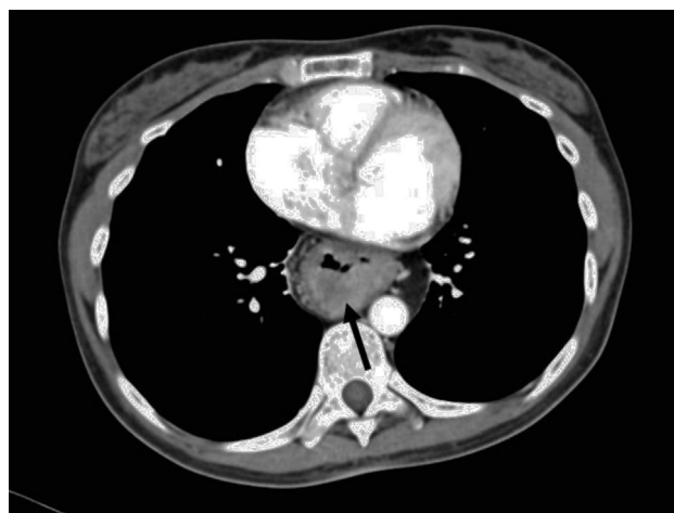
Figura 1 Tomografía computarizada de tórax que demuestra masa intraluminal en tubo gástrico interpuesto.

Se propone terapéutica quirúrgica con gastrectomía transtorácica derecha con ascenso colónico por vía retroesternal. Mediante abordaje cervical, transtorácico anterolateral derecho y supraumbilical, se realizó una