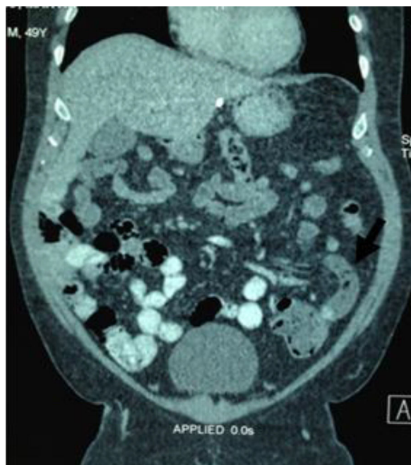
Figura 2 Corte coronal de tomografía abdominal. Apendicitis aguda en el hemiabdomen izquierdo (flecha negra), sin evidencia de otros síndromes asociados.