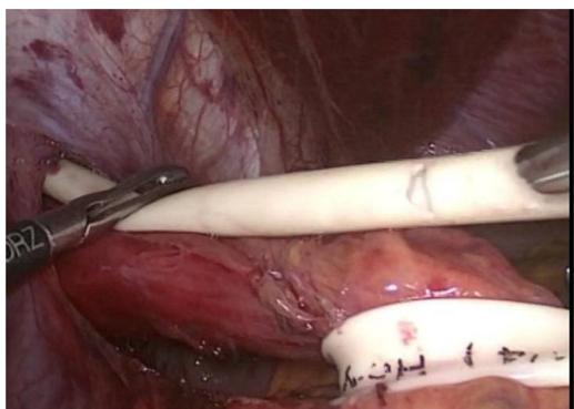
Figura 1 Se realiza medición transoperatoria en la cara anterior del esófago con penrose para delimitar longitud de miotomía, sin realizar tracción caudal sobre la unión gastroesofágica para no elongar los tejidos.