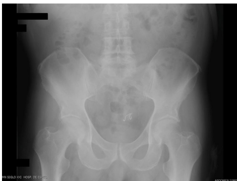
Figura 1 Radiografía simple de abdomen con prótesis dental en sigmoides.

Los autores declaran no tener ningún conflicto de intereses.