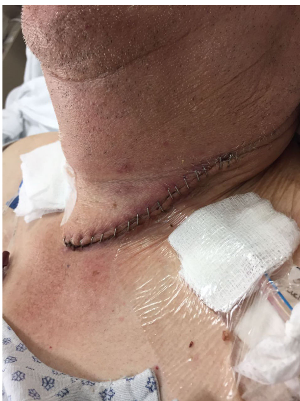
Figura 2 Fuga de anastomosis clínica con presencia de eritema en herida quirúrgica y salida de saliva a través del drenaje Jackson-Pratt, confirmado con amilasa.

Se realizó estadística descriptiva, calculando porcentajes y medias. Se calculó la sensibilidad del estudio contrastado para la detección de fugas de la anastomosis tomando como estándar de oro al diagnóstico clínico de dicha fuga.