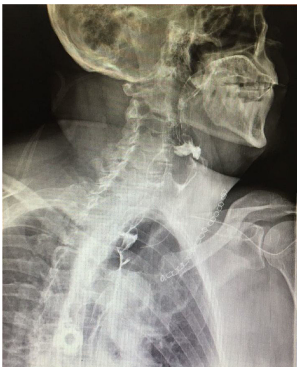
Figura 1 Estudio contrastado postesofagectomía en el que no se observa la extra-luminización del material contrastado.