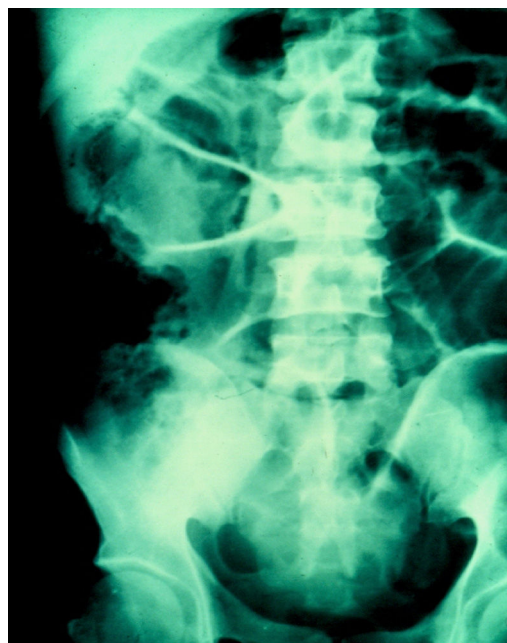
Figura 1 Imagen radiológica con distensión de asas intestinales y neumatosis en el ciego.

Paciente masculino de 67 años de edad, con diabetes mellitus tipo II. Padecimiento de 7 días de evolución con evacuaciones diarreicas con moco y sangre en número de 6 a 8 al día, fiebre, náuseas y vómito de contenido gástrico, así como dolor abdominal tipo punzante en los últimos 3 días, inicialmente en el cuadrante inferior derecho y finalmente generalizado. A la exploración presenta taquicardia, taquipnea e hipertermia de 38.7° C. Abdomen agudo, con resistencia muscular, signo de descompresión positiva, y peristaltismo disminuido. Exámenes de laboratorio con leucocitosis, neutrofilia y bandemia. En las placas simples de abdomen de pie y en decúbito, se observó distensión de asas intestinales y neumatosis de la pared del ciego (figs. 1 y 2). En la laparotomía, se encontraron zonas de necrosis en todo el colon, con natas fibrinopurulentas, y crepitación en el ciego. Se realizó colectomía subtotal (fig. 3). Las pruebas de hemaglutinación indirecta y PCR apoyaron el diagnóstico de amibiasis invasora. El estudio histopatológico reportó trofozoitos hematófagos de Entamoeba histolytica en la pared del colon 1,2 e infiltrado linfoplasmocitario (fig. 4).