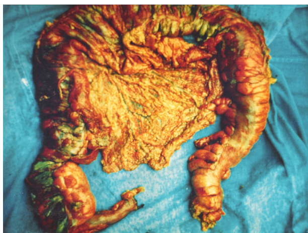
Figura 3 Pieza quirúrgica de colectomía subtotal.