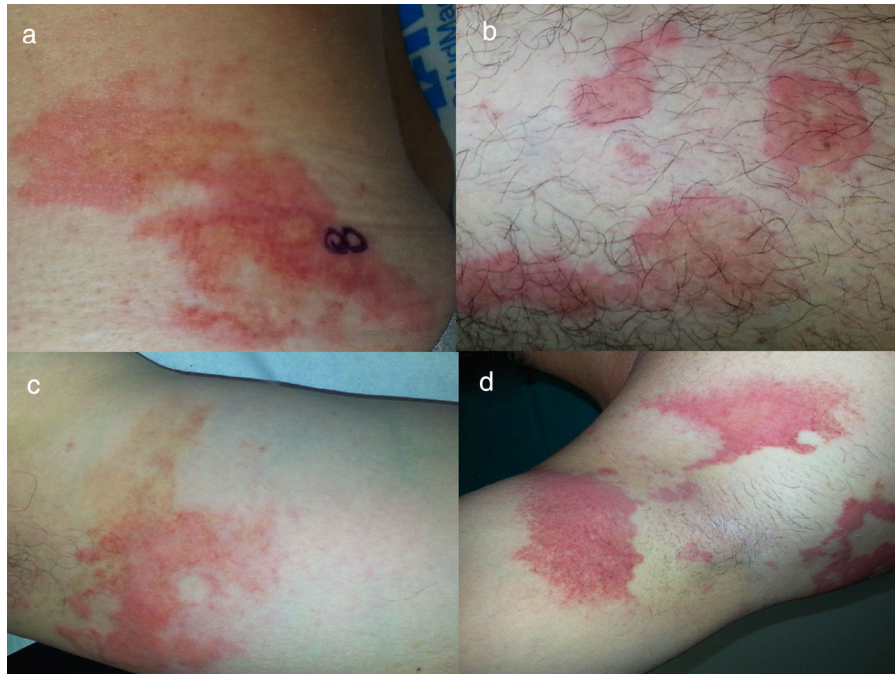
Figura 2. Urticaria prolongada, sin vasculitis leucocitoclástica. Los 4 pacientes tienen al menos una biopsia que muestra la presencia de un infiltrado inflamatorio linfocitario perivascular superficial, con o sin eosinófilos, sin vasculitis. Nótese la presencia de un componente equimótico en el interior de las lesiones agudas (a y b) y sobrepasando los límites de las mismas (c y d).

Derecho a la privacidad y consentimiento informado. Los autores han obtenido el consentimiento informado de los pacientes y/o sujetos referidos en el artículo. Este documento obra en poder del autor de correspondencia.