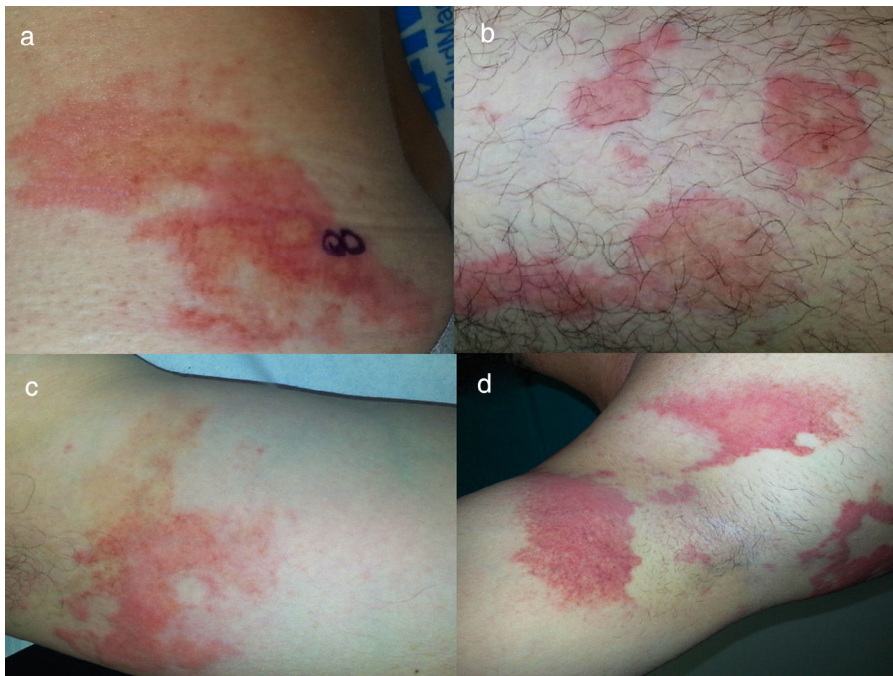
Figura 2. Urticaria prolongada, sin vasculitis leucocitoclástica. Los 4 pacientes tienen al menos una biopsia que muestra la presencia de un infiltrado inflamatorio linfocitario perivascular superficial, con o sin eosinófilos, sin vasculitis. Nótese la presencia de un componente equimótico en el interior de las lesiones agudas (a y b) y sobrepasando los límites de las mismas (c y d).

Derecho a la privacidad y consentimiento informado. Los autores han obtenido el consentimiento informado de los pacientes y/o sujetos referidos en el artículo. Este documento obra en poder del autor de correspondencia.