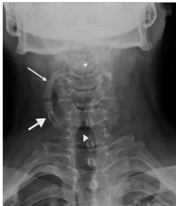
Figura 1. Costilla cervical proximal (flecha fina) que se origina en el cuerpo vertebral C3 (estrella) dirigiéndose hacia caudal y se articula con otra costilla supernumeraria distal (flecha gruesa) con trayectoria ascendente, que parte desde el cuerpo vertebral C7 (punta de flecha).

Las costillas cervicales son prolongaciones de la apófisis transversa de la séptima vértebra cervical más allá de la apófisis transversa de la primera costilla torácica. Su incidencia es diferente en los distintos países 1,2-7 , aunque se estima que ronda entre el 0,2 y el 8%, y es más frecuente en las mujeres 3,5,7 . Pueden ser unilaterales o bilaterales (estas últimas 50-80%), con pobre predominio derecho cuando son unilaterales 2,8 . En el 90% de los casos