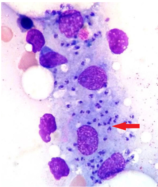
Figura 1. Biopsia de médula ósea: se observan varios macrófagos con amastigotes de Leishmania en su interior (flecha).

de una semana de evolución. En la exploración física se objetivan leves crepitantes bibasales. No se observan adenopatías, visceromegalias ni otros datos de focalidad infecciosa. Analíticamente, presenta pancitopenia (hemoglobina de 10,9 g/dl, 2.050 leucocitos con 1.310 neutrófilos/ \mu l y 49.000 plaquetas/ \mu l), proteína C reactiva (PCR) de 104 mg/l y velocidad de sedimentación globular de 110 mm/h. Inicialmente, se sospechó toxicidad medular por metotrexato, con probable sobreinfección bacteriana.