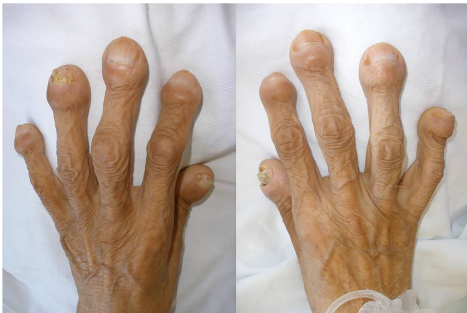
Figura 1. Acropaquias bilaterales de gran tamaño.