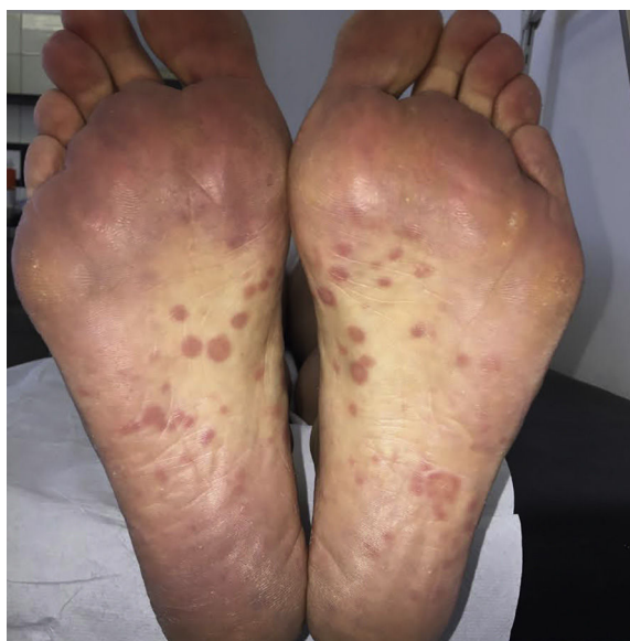
Figura 1. Placas asalmonadas en las plantas de ambos pies.