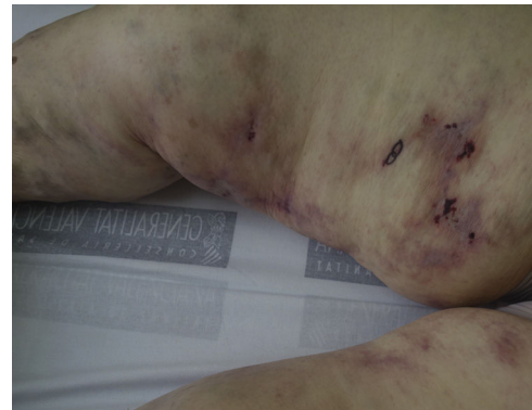
Figura 1. Imagen clínica de las lesiones cutáneas.

La vasculopatía livedoide es una enfermedad poco frecuente, crónica y dolorosa, caracterizada por la presencia de máculas o pápulo-placas purpúricas con tendencia a la formación de úlceras irregulares, que evolucionan a cicatrices atróficas de morfología estrellada e hiperpigmentación periférica, descritas como atrofia blanca 3 . Suele afectar preferentemente a los miembros inferiores, con una distribución bilateral y simétrica. Es característica, aunque no constante, la asociación con livedo reticularis.