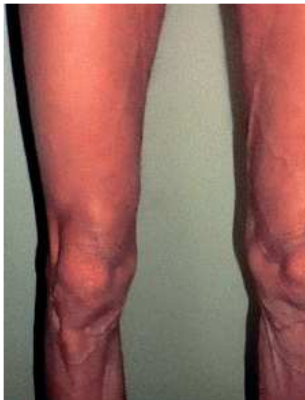
Fig. 7. Mujer con delgadez de las piernas.

La patogenia del síndrome de lipodistrofia es desconocida. Sin embargo, se sospecha que tiene que ver con la introducción de los IP en el tratamiento antirretroviral.