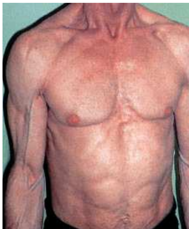
Fig. 4. Varón con pérdida de grasa subcutánea que le confiere un aspecto atlético.

de la grasa periférica (mediana de tiempo, 12 meses). Resulta difícil determinar la prevalencia de lipodistrofia porque el diagnóstico de esta entidad se ha basado en definiciones clínicas subjetivas. Las estimaciones de prevalencia varían mucho dependiendo de la definición