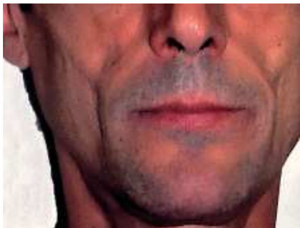
Fig. 5. Varón con una característica pérdida de la grasa de la bolsa de Bichat (mejillas).