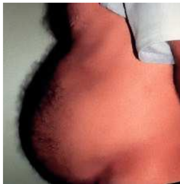
Fig. 1. Varón con una importante acumulación de grasa abdominal.

Varios autores han descrito pacientes que desarrollaron obesidad central en forma de aumento de la grasa vis- ceral, hipertrofia mamaria o acumulación de grasa cer- vical o interescapular («joroba de búfalo») (figs. 1-3). Los pacientes tratados con IP con obesidad central te- nían, además, una disminución de grasa abdominal subcutánea en comparación con los controles sin lipo- distrofia. Por otra parte, la mayoría de los pacientes con obesidad central experimentaron un aumento del peso corporal desde el comienzo del tratamiento con IP.