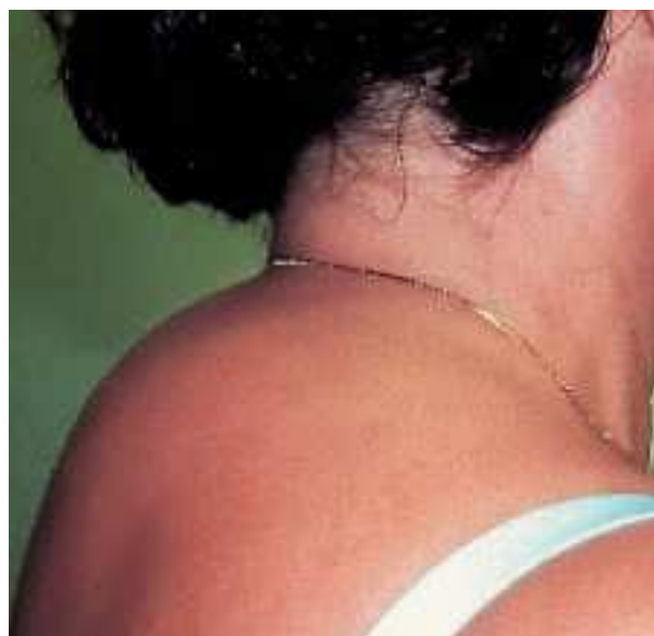
Fig. 3. Mujer que ha desarrollado una acumulación de grasa en la región interescapular («joroba de búfalo»).

Al revisar la bibliografía, es posible comprobar que la aparición clínica de determinados cambios en la distribución de la grasa corporal puede depender de la duración del tratamiento con IP. Los efectos beneficiosos del tratamiento con IP en cuanto al peso y al estado nutricional se han comunicado al cabo de muy poco tiempo (3-6 meses). La aparición de lipodistrofia se ha descrito en pacientes que, generalmente, llevaban más de 6 meses de tratamiento con IP. Los cambios en la distribución de la grasa corporal parece que se desarrollan antes en aquellos con un predominio de obesidad central (mediana de tiempo, 6 meses) que en aquellos con un predominio de pérdida