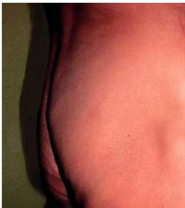
Fig. 6. Varón con atrofia de las nalgas.

de lipodistrofia, el diseño del estudio, el área geográfica y el tiempo transcurrido desde el inicio del tratamiento con IP. De este modo, la tasas de prevalencia de lipodistrofia que se han comunicado oscilan entre el 2 y el 84% después de 3-18 meses de tratamiento con IP.