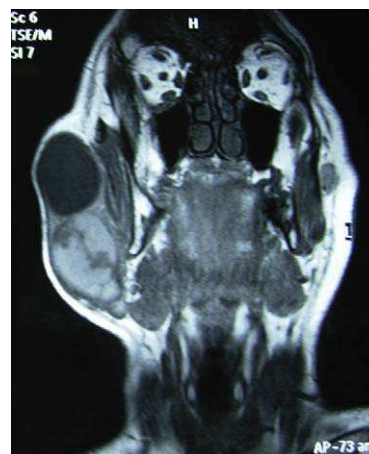
Figura 2 RMN coronal en la que se aprecia el contenido quístico superior frente al sólido inferior.

Se trata de un paciente varón de 72 años remitido a consultas externas por presentar una tumoración parotídea