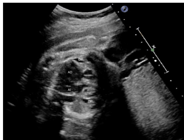
Figura 1 Cardiomegalia y derrame pericárdico (DP) en feto con agenesia de ductus venoso con drenaje de vena umbilical a aurícula derecha (AD). AI: aurícula izquierda.

Se realizó un estudio retrospectivo descriptivo de los niños nacidos entre 2009 y 2016 con diagnóstico prenatal de