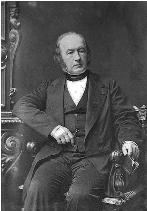
Figura 2 Claude Bernard (1813-1878) se le considera el padre de la medicina experimental.

Alemania) investigaron las funciones del páncreas como glándula capaz de reducir los niveles de glucosa en sangre. Durante el año 1889, estando trabajando en la Universidad de Estrasburgo, realizaron una pancreatometomía a un perro para averiguar si el páncreas era necesario para la vida. Después de la operación observaron que el perro mostraba todos los síntomas de una diabetes con poliuria, polidipsia e hiperfagia. Minkowski observó la presencia de hiperglucemia e intensa glucosuria. De esta forma se demostró que el páncreas era necesario para regular los niveles de glucosa y se abrió el camino de las investigaciones para tratar de aislar de esa glándula de secreción mixta el principio activo que pudiera servir para el tratamiento de la diabetes 23 .