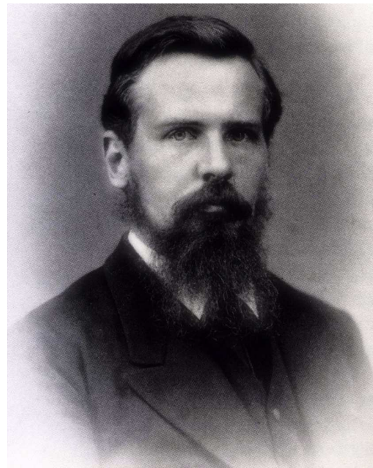
Figura 1 Paul Langerhans (1847-1888) describió los islotes pancreáticos en 1869.