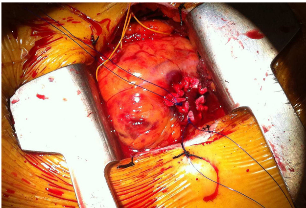
Figura 2. Cirugía abierta.

El implante se realiza bajo estimulación ventricular rápida, como en todos los procedimientos con prótesis balón-expandibles, y en este sentido en la vía TAP podemos utilizar electrodos epicárdicos izquierdos, que dejaremos exteriorizados al terminar el procedimiento, como es práctica habitual en la cirugía abierta por si se produce un bloqueo (fig. 2). Un pequeño truco que se utiliza en algunos centros, y que a nosotros nos ha sido de utilidad, es utilizar de nuevo la estimulación ventricular rápida para la retirada del introductor y el anudado de bolsas. Ello reduce la tensión de la pared