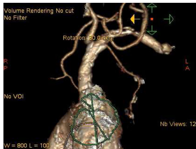
Figura 4. Salida de la mamaria.

El antecedente de un pontaje permeable realizado con mamaria interna izquierda no contraindica el abordaje axilar izquierdo 24 , aunque en este caso concreto se deberían extremar las precauciones: en nuestra opinión, debería darse prioridad a otras vías si son adecuadas, y hay que asegurarse de que el calibre del vaso permite ampliamente el paso de la prótesis. En nuestra experiencia, hemos tenido un caso de oclusión de la axilar varios meses después del abordaje para TAVI (fig. 3), en un paciente en que se utilizó la vía axilar como último recurso. Afortunadamente, la oclusión de la axilar fue distal a la salida de la mamaria (fig. 4). La oclusión de pontajes de mamaria ha sido también reportada como complicación en la literatura 25 . El hecho de que en la vía TAX solo disponga de certificación CE la prótesis CoreValve puede tener, en nuestra opinión, una desventaja adicional, ya que este dispositivo se asocia a un mayor porcentaje de bloqueos cardiacos con necesidad de implante definitivo de marcapasos 9,26 , lo que no es una complicación banal por sus implicaciones en cuanto