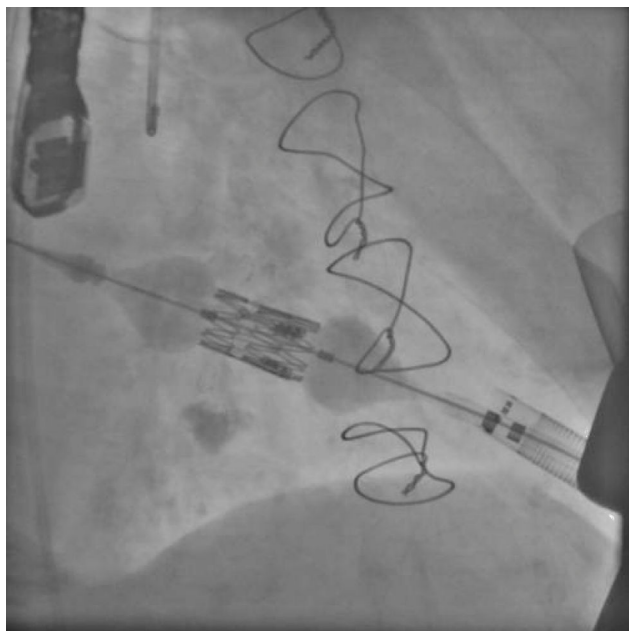
Figura 3. Prótesis TAVI.

terminolateralmente un injerto de dacrón o Gore-Tex, a través del cual se introducirán las guías, los catéteres y las prótesis.