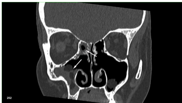
Figura 1 TC dos seios. Polipose de seios maxilar e etmoide (setas brancas) em um paciente após cirurgia prévia do seio, que foi submetido a transplante de células-tronco hematopoiéticas alogênico devido a mielofibrose primária.

A sinusite crônica foi diagnosticada quando havia pouca melhoria sintomática/radiológica ou se os sintomas recorreram após três ou mais semanas de terapia antimicrobiana. 2