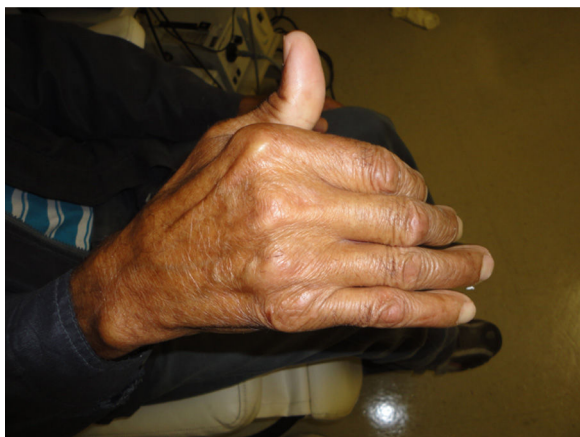
Figura 3 Mão em garra.

alimentar. Evidenciou-se também a presença de sialorreia relativa por dificuldade deglutitória.