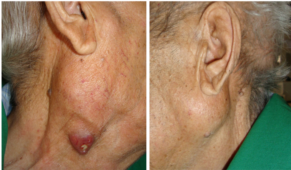
Figura 1 Inchaço bilateral das glândulas parótidas. A glândula parótida direita mostra uma pequena úlcera indolor, com supuração contínua.