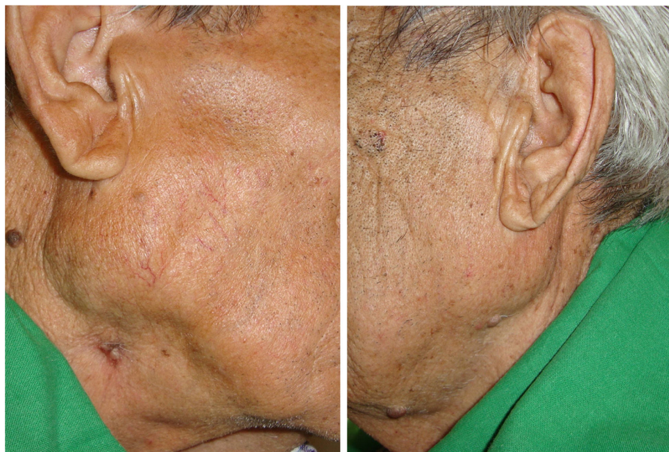
Figura 3 Imagens obtidas após o término do tratamento (10 meses). O inchaço na glândula parótida diminuiu em ambos os lados e a lesão ulcerativa do lado direito foi curada.

sexo masculino e fumante levou-nos a incluir o tumor de Warthin como um diagnóstico possível, já que ele aparece como uma massa cística indolor e de crescimento lento que afeta principalmente a glândula parótida. Em 15% dos casos pode afetar ambas as glândulas e não costuma se tornar maligno.