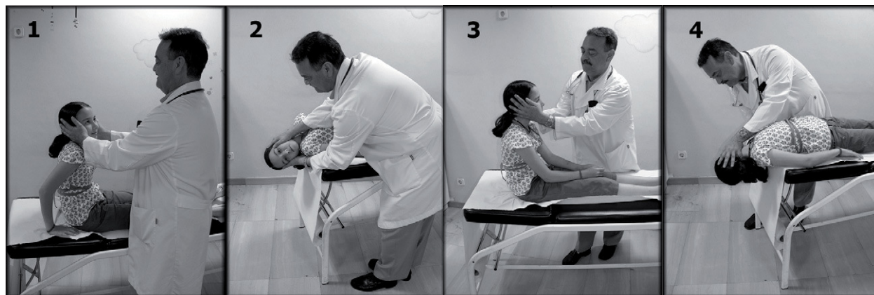
Figura 1. Maniobra de Dix-Hallpike: 1. Se sitúa al paciente sentado en la camilla y se gira la cabeza a un lado unos 45°. 2. Se tumba rápidamente hacia atrás hasta situarlo en decúbito supino con la cabeza colgando unos 20°, manteniendo esta posición al menos 40 s y observando la aparición de nistagmo. 3. Sentamos al paciente observando la inversión del nistagmo. 4. Repetimos la maniobra hacia el lado contrario.