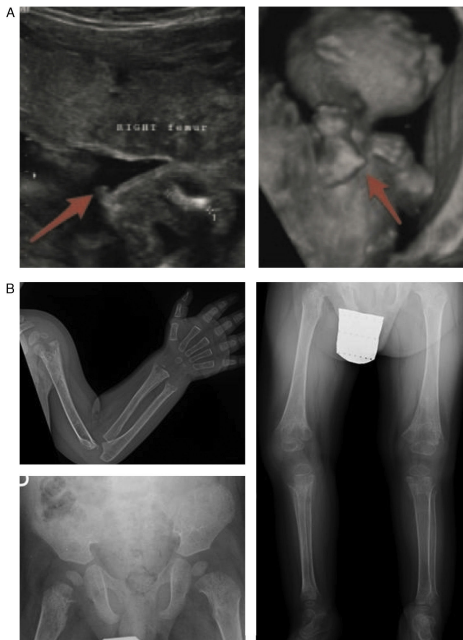
Figura 2 Hallazgos característicos en las pruebas de imagen de la hipofosfatasa perinatal letal (a) y de la hipofosfatasa del lactante (b). a) Ultrasonografía a las 18 semanas de gestación: espolones óseos en la rodilla derecha y en el codo derecho (3D). b) Estudio radiológico en paciente de 17 meses de edad: marcada alteración en metáfisis de huesos largos (proximales de ambos húmeros, distales de ambos radios y cúbitos y proximales de ambos fémures, tibias y peronés), que se encuentran ensanchadas, con pérdida de densidad ósea, trabéculas groseras y proyecciones radiolucientes que se extienden desde la fisis hacia la metáfisis. Reacción perióstica lineal en el radio izquierdo.