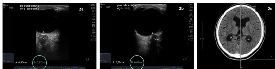
Figura 2 Ecografía de la VNO posdrenaje: diámetro lado derecho (a) 0,68-0,65 cm (disminución en relación con inicial) y lado izquierdo (b) 0,44-0,42 cm (normal). Resonancia magnética de control al mes (c): disminución del tamaño del sistema ventricular con disminución de la hiperintensidad circundante.