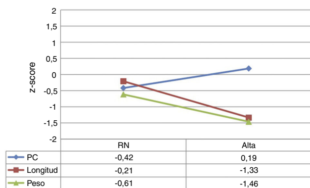
Figura 1 Evolución de los valores de z-score de peso, longitud y perímetro craneal (PC) al nacimiento y al alta hospitalaria, según las tablas de Fenton 2013.

DAP: ductus arterioso persistente; DE: desviación estándar; EG: edad gestacional; IQ: primer y tercer cuartiles; O 2 : oxígeno; P10: percentil 10 según tablas de Fenton 2013; PC: perímetro craneal. UCIN: unidad de cuidados intensivos neonatales; VM: ventilación mecánica en algún momento durante el ingreso.