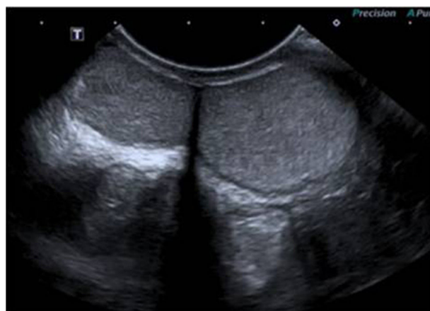
Figura 1 Ecografía escrotal izquierda: demuestra 2 estructuras ecográficamente similares, compatibles con 2 testículos.

Finalmente se realizó exploración quirúrgica por vía inguinal que demostró 2 testículos a nivel escrotal izquierdo (fig. 2). Se decidió la exéresis del teste supernumerario, ante la ausencia de potencial reproductivo, y la posibilidad de degeneración maligna. La anatomía patológica mostró una estructura testicular conservada.