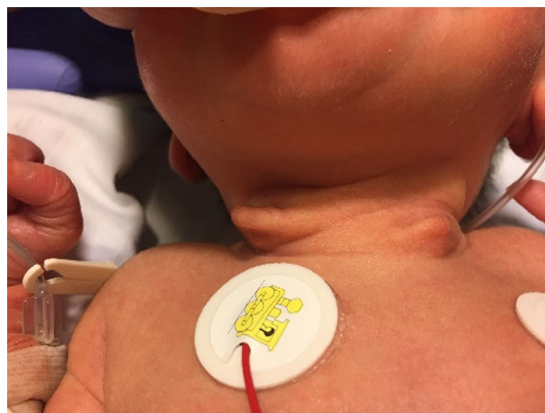
Figura 1 Apéndices laterocervicales sin orificio de salida, de consistencia cartilaginosa.

Los vestigios condrocútaneos cervicales son lesiones congénitas benignas poco frecuentes, asintomáticas, localizadas en posición anterior al músculo esternocleidomastoideo, secundarias a un remanente de los arcos branquiales (predominantemente el segundo arco branquial) 1 . Se componen de tejido cutáneo con núcleo cartilaginoso, sin incluir estructuras vasculares en su interior. Son más comunes en varones, y pueden tener asociación familiar 2 . El carácter bilateral es muy infrecuente, presentando una mayor incidencia de malformaciones, tales como: cardíacas (defectos del septo auricular), gastrointestinales (hernia inguinal),