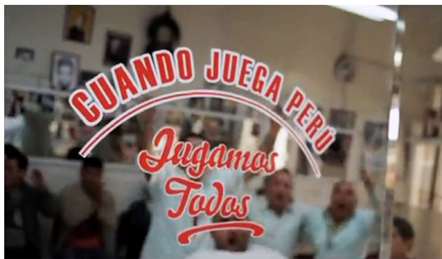
Figura 2 El llamamiento a la selección es representado como algo irrenunciable (Cristal Perú, 2011: 0'13").

Es revelador notar cómo una representación que se construye en primera instancia como una invitación (en este caso, a ser parte de la nación peruana a través del fútbol), pueda esconder debajo de sus texturas otro tipo de mensajes a priori no-dichos. Si los argumentos sobre lo nacional se discuten en torno a una ideología publicitaria que propone subirse al carro del aliento a la selección de fútbol a fin de sentirse, de cierta manera, incluido, ¿Qué ocurre con aquellas personas que no se sienten interpeladas con el supuesto sentimiento de pertenencia nacional que genera el fútbol? ¿Acaso serán menos parte de la nación? Y peor aún ¿Dónde quedan los peruanos de las zonas rurales alejadas que muy poco saben de los goles de Pizarro o Guerrero? ¿Quedarán