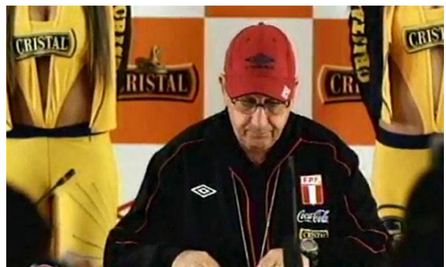
Figura 1 Sergio Markarián anuncia la lista de convocados de la selección peruana (Cristal Perú, 2011: 0'08").

A partir de allí, el entrenador uruguayo continúa designando una serie de nombres que nada tienen que ver con futbolistas profesionales, sino con personas comunes y corrientes, con oficios (o incluso aparentemente sin tenerlos) y profesiones de diversa índole: profesora universitaria, barman, pescador, panadero, obrero, mototaxista, bombero; y también de distintas regiones del Perú ya que se puede observar en el spot tanto áreas urbanas como zonas periféricas rurales de la sierra y selva. Al final del spot, la marca anunciante, Cerveza Cristal, mediante una locución