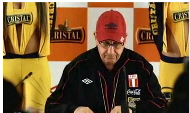
Figura 1 Sergio Markarián anuncia la lista de convocados de la selección peruana (Cristal Perú, 2011: 0'08").

A partir de allí, el entrenador uruguayo continúa designando una serie de nombres que nada tienen que ver con futbolistas profesionales, sino con personas comunes y corrientes, con oficios (o incluso aparentemente sin tenerlos) y profesiones de diversa índole: profesora universitaria, barman, pescador, panadero, obrero, mototaxista, bombero; y también de distintas regiones del Perú ya que se puede observar en el spot tanto áreas urbanas como zonas periféricas rurales de la sierra y selva. Al final del spot, la marca anunciante, Cerveza Cristal, mediante una locución