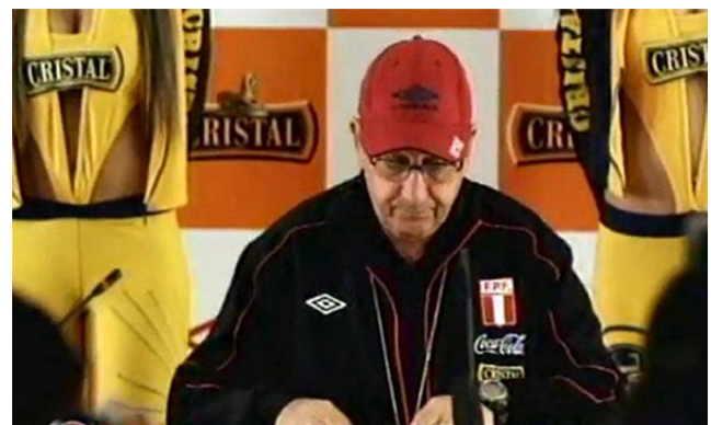
Figura 1 Sergio Markarián anuncia la lista de convocados de la selección peruana (Cristal Perú, 2011: 0'08").

A partir de allí, el entrenador uruguayo continúa designando una serie de nombres que nada tienen que ver con futbolistas profesionales, sino con personas comunes y corrientes, con oficios (o incluso aparentemente sin tenerlos) y profesiones de diversa índole: profesora universitaria, barman, pescador, panadero, obrero, mototaxista, bombero; y también de distintas regiones del Perú ya que se puede observar en el spot tanto áreas urbanas como zonas periféricas rurales de la sierra y selva. Al final del spot, la marca anunciante, Cerveza Cristal, mediante una locución