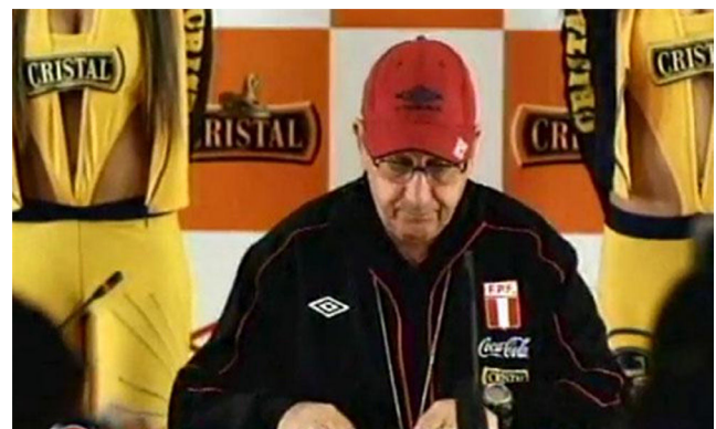
Figura 1 Sergio Markarián anuncia la lista de convocados de la selección peruana (Cristal Perú, 2011: 0'08").

A partir de allí, el entrenador uruguayo continúa designando una serie de nombres que nada tienen que ver con futbolistas profesionales, sino con personas comunes y corrientes, con oficios (o incluso aparentemente sin tenerlos) y profesiones de diversa índole: profesora universitaria, barman, pescador, panadero, obrero, mototaxista, bombera; y también de distintas regiones del Perú ya que se puede observar en el spot tanto áreas urbanas como zonas periféricas rurales de la sierra y selva. Al final del spot, la marca anunciante, Cerveza Cristal, mediante una locución