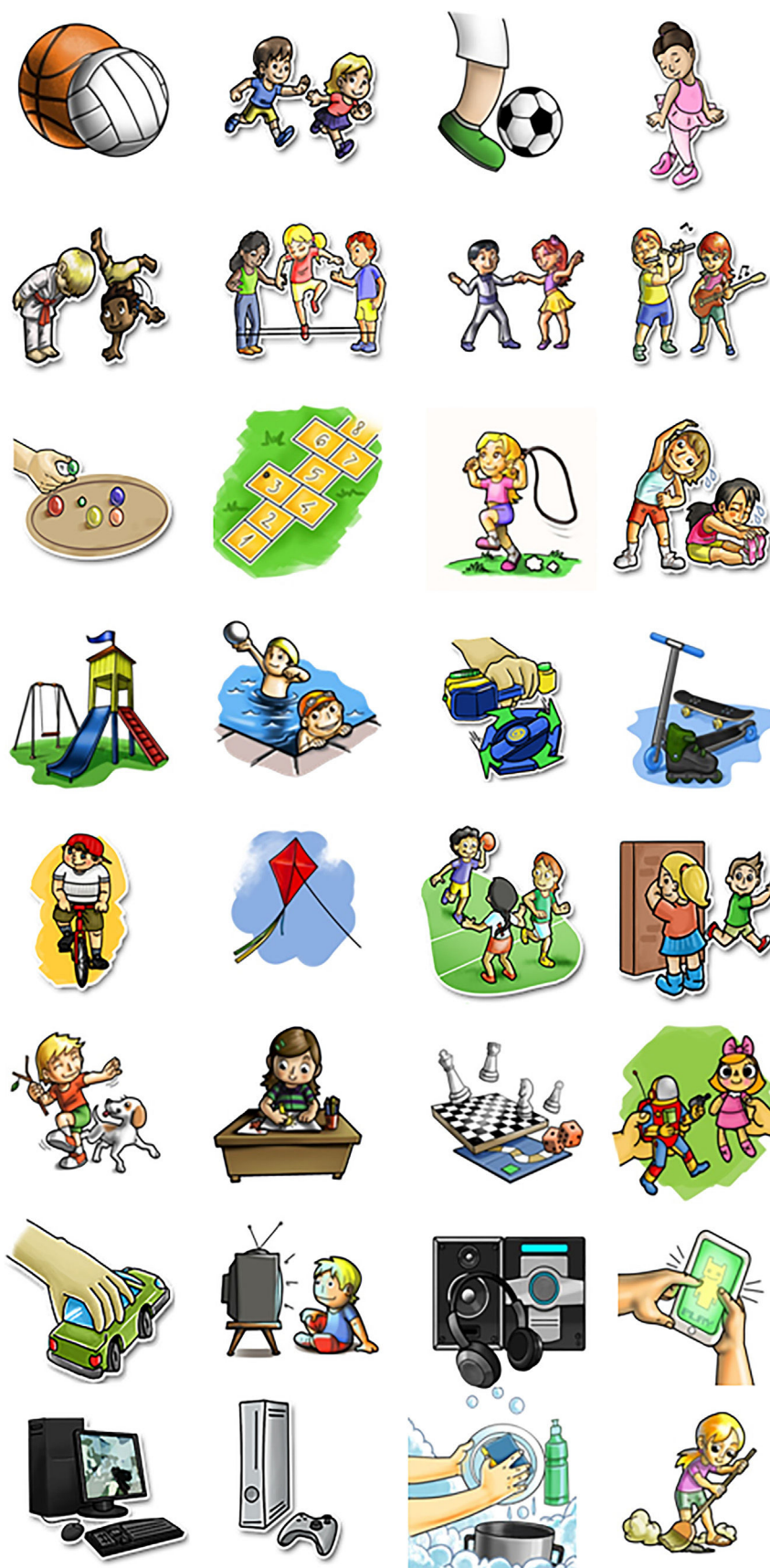
Figura 1 Ícones de atividades físicas e sedentárias do Web-CAAFE (Jesus et al., 2016).