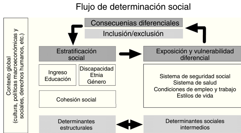
Figura 2. Propuesta de actualización de modelo de determinantes sociales de la salud. Elaboración propia, a partir del esquema de la Comisión de Determinantes Sociales de la Salud, OMS (2005).

Así, proponemos utilizar la relación entre inclusión y exclusión social como resultante de la acción de los DSS. La inclusión social se refiere a las oportunidades que tienen los individuos para participar en áreas clave de la vida económica, social y cultural 1 . A su vez, el término «exclusión social» describe la alienación o la privación de derechos que ciertos individuos o grupos pueden sufrir dentro de la sociedad. A los excluidos socialmente se les atribuye poco valor social; pueden estar marginados económica, política y socialmente, y no pueden disfrutar de las oportunidades económicas y sociales disponibles para otros, incluyendo el disfrute de una buena salud. La exclusión social niega a las personas sus derechos humanos fundamentales.