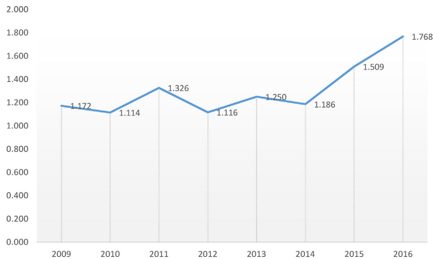
Figura 2. Evolución del factor de impacto.

cer cuartil en los índices del Science Citation Index, concretamente en el lugar 94 de 173, y en el segundo cuartil (lugar 67 de 157) en el Social Sciences Citation Index en la clasificación Public, Environmental & Occupational Health del Journal Citation Reports, siendo la primera revista en lengua distinta del inglés de esta categoría para ese mismo año.