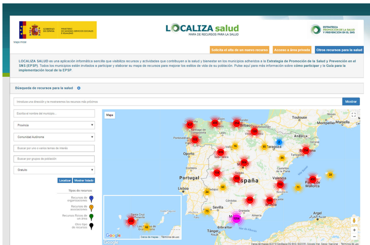
Figura 1. Mapa de recursos para la salud.