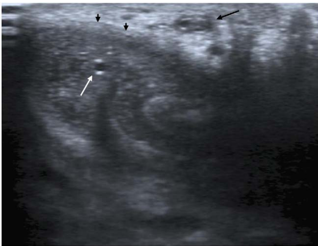
Figura 3 Ecografía modo B en corte axial. Trombosis de la vena dorsal (flecha negra), cuerpo cavernoso (puntas de flecha) y arteria cavernosa (flecha blanca).

les del pene. Es una entidad que está en íntima relación con traumatismos mecánicos intensos y repetidos sobre el pene. El cuadro clínico evoluciona en tres estadios: agudo, subagudo y de recanalización 2 . El primero aparece a las 24-48 horas, es el menos constante y se asocia a dolor intenso y ocasionalmente fiebre. Posteriormente, en el estadio subagudo, el dolor disminuye y pueden presentarse síntomas irritativos miccionales que duran de 4-8 semanas. Por último, se produce la recanalización de la vena y resolución del cuadro en 6-8 semanas.