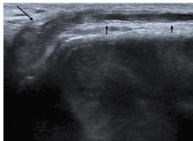
Figura 1 Ecografía doppler peneana (modo B, corte longitudinal). Trombosis de la vena dorsal del pene (flechas). Modo B: corte longitudinal.

Aunque inicialmente Mondor en 1939 describió la trombosis de venas superficiales de la pared torácica, fue Braun-Falco el que presentó la flebitis de las venas dorsa-