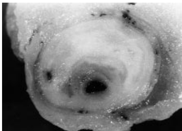
Fig. 2. Visión macroscópica de arteria coronaria con reducción de más del 80% de la luz por placa de ateroma.