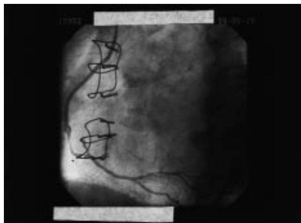
Fig. 1. Angiografía en OAD (oblicua anterior derecha) del injerto de vena safena a coronaria derecha distal. Existe una estenosis larga y severa en el extremo distal del injerto.