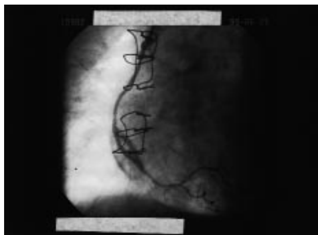
Fig. 2. Tras la realización de la angioplastia coronaria con balón en la lesión del injerto de safena, se observa una extravasación del contraste alrededor del lugar de la dilatación.

rivaciones de la cara inferior del electrocardiograma que se normalizaban al desaparecer el dolor. Fue tratada con nitroglicerina intravenosa, aspirina y heparina sódica, y a las 48 h del ingreso presentó, a pesar de la terapia antianginosa, nuevos episodios de angina de reposo de difícil control farmacológico. Dada la refractariedad de la angina al tratamiento médico, se realizó cateterismo cardíaco con el siguiente resultado: estenosis severa del tronco común izquierdo y de los tres vasos coronarios principales; injerto de arteria mamaria interna a arteria descendente anterior e injerto de