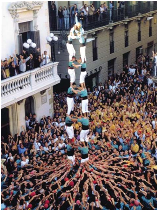
Fig. 3. «Torre de vuit» cargada por los Castellers de Vilafranca. La tradición catalana de los castellers simboliza muy bien el trabajo y la ilusión a lo largo del tiempo de un equipo numeroso de gente, de diferente edad y origen, unida para conseguir un objetivo común.