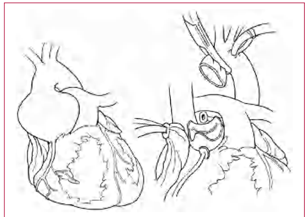
Fig. 1. Aneurisma de la raíz aórtica y disección de los senos aneurismáticos.

Full English text available from: www.revespcardiol.org