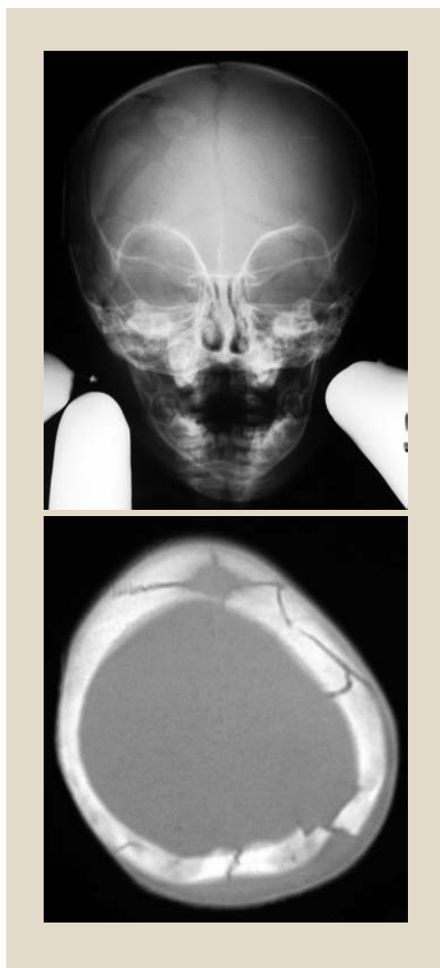
Figura 1. Fractura craneal en lactante de 10 meses. A pesar de su aparatosisidad, no presentó lesión intracraneal y la puntuación en la escala de Glasgow modificada fue en todo momento de 15.

mitos o cefalea no tienen suficiente valor predictivo, aunque según su intensidad o persistencia podrán ser motivo de alarma 13-15 . Es necesario elegir la exploración de diagnóstico por la imagen que consideremos más adecuada.