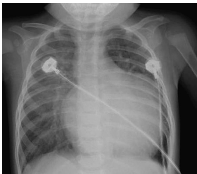
Figura 2. Imagen radiológica característica de paciente con origen anómalo de la arteria coronaria izquierda del tronco de la arteria pulmonar. Destaca la cardiomegalia a expensas de cavidades izquierdas.

Antes de la descanulación, se realizó ETEI de control a todos los pacientes sometidos a cirugía mitral concomitante (4 casos, 27%). En 2 casos, la ETEI informó ausencia de insuficiencia mitral. Otro paciente quedó con insuficiencia mitral moderada residual, pero