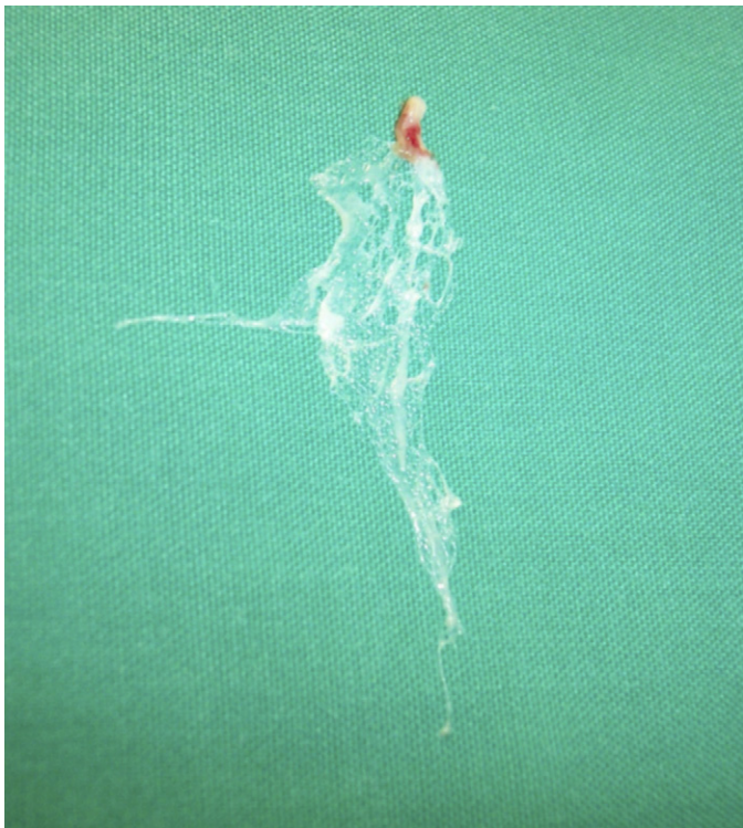
Figura 2. Red de Chiari ampliamente desarrollada tras su resección quirúrgica.

paroxística. Se ha descrito su presencia en hasta un 4% de las autopsias 1,2 , con frecuencia asociado a foramen oval permeable, si bien se consideraba un hallazgo con escaso significado patológico 3-5 . Recientemente algunas publicaciones han descrito este hallazgo en pacientes con eventos tromboembólicos, en los que podría tener algún papel 6-10 .