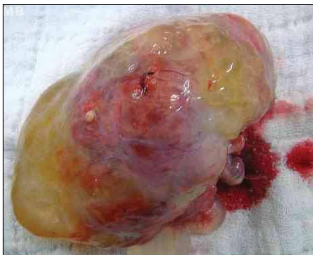
Figura 2 – Teratoma imaturo ovariano: aspecto macroscópico.

A paciente foi submetida à laparotomia, com coleta de líquido ascítico para citologia oncótica. Foi evidenciado cisto complexo em ovário direito pesando 680 g, multiseptado, com áreas de ruptura capsular. Realizada salpingo-ooforectomia à direita, e o material foi enviado para exame com congelação com laudo de maligno. O ovário esquerdo apresentava volume aumentado com áreas císticas (Figura 2).