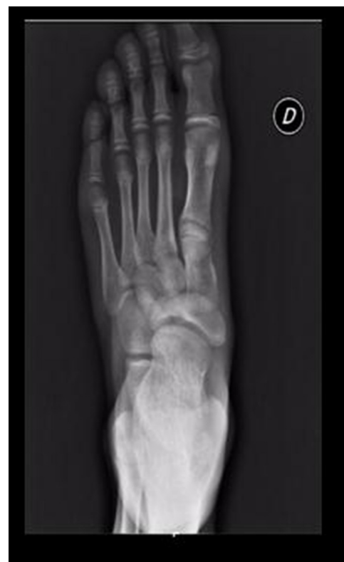
Figura 1 Radiografía anteroposterior: alteración en la morfología del escafoides tarsiano en forma de «coma». Primer metatarsiano corto.

Consultó en el servicio médico por dolor en el pie izquierdo acompañado de impotencia funcional en el contexto de una contusión durante un partido. A la exploración