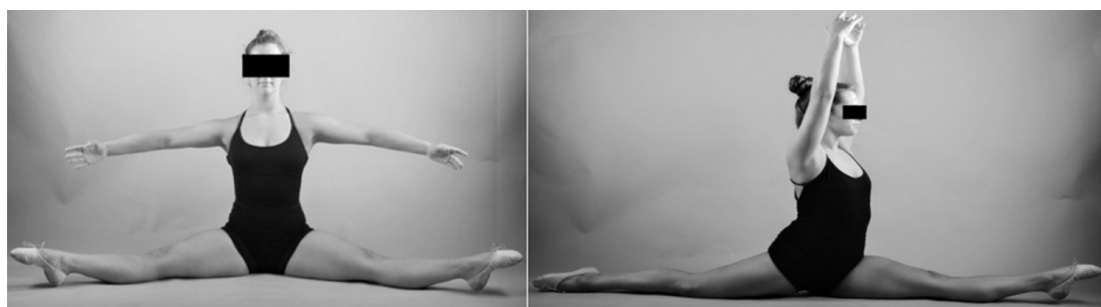
Figura 4 D'esquerra a dreta: Grand écart facial , Grand écart latéral .

Quant al nombre de lesions, en el grup d'intervenció 5 de 17 ballarines presentaren una lesió, en comparació amb el