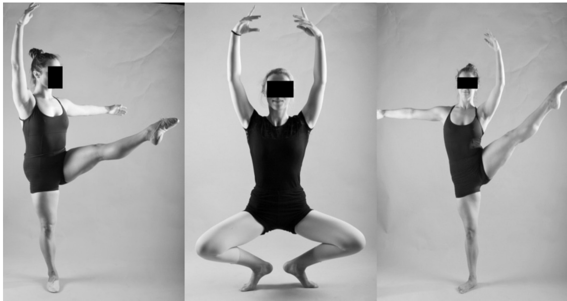
Figura 3 D'esquerra a dreta: Développé devant , Grand plié , Développé à la seconde .

IL-18, interleucina-6 [IL-6]), el component del complement 3 (C3) i les concentracions d'immunoglobulina (Ig) (IgA i IgM) en ballarines. També es verificà la mort de neutròfils i l'alliberament d'espècies reactives d'oxigen (ROS). Tots marcadors del dany muscular.