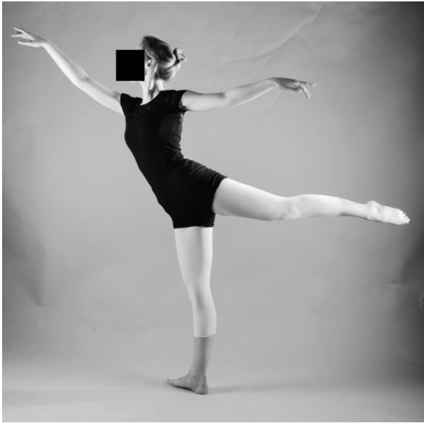
Figura 2 Arabesque.