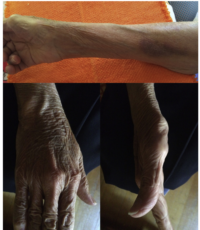
Figura 2. Mano y antebrazo 3 semanas después; práctica resolución del cuadro (persiste ligera equimosis en el antebrazo).

El SCA se produce por el aumento de la presión en 1 o varias celdas fasciales que lleva a una disminución de la presión de perfusión e isquemia muscular y nerviosa. Su diagnóstico rápido es vital, ya que, sin un tratamiento precoz, es una entidad grave y