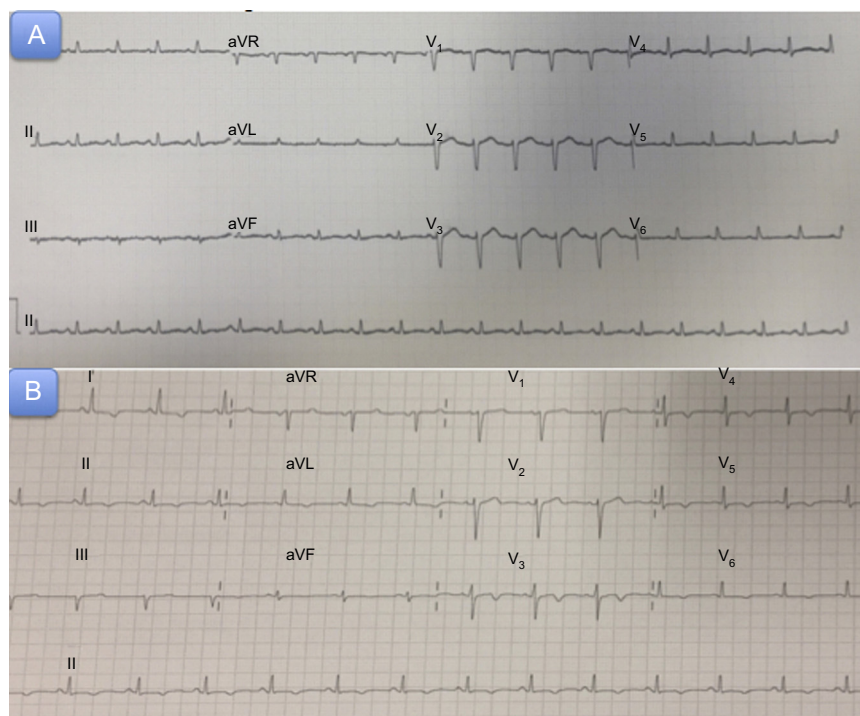
Figura 1. A: electrocardiograma al ingreso. B: electrocardiograma a las 72 h del cuadro agudo.

Durante su estancia en urgencias, la paciente tuvo una mala evolución clínica, con aparición de insuficiencia respiratoria y acidosis metabólica láctica (ácido láctico, 4,2 mmol/l) asociado a molestias abdominales. Se solicitó tomografía computarizada toracoabdominal por sospecha de cuadro séptico, y se observaron signos de insuficiencia cardíaca congestiva y derrame pericárdico de ligera cuantía (máximo diámetro, 12 mm) (figura 2 B). Se realizó