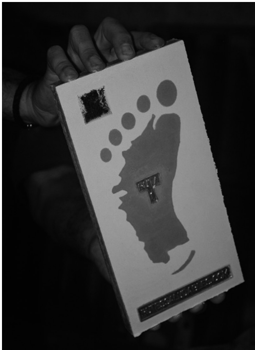
Figura 3 Rajola il·lustrativa del programa utilitzada per assenyalar les rutes saludables en els municipis de l'illa.

tats esportives, amb la col·laboració de les administracions públiques locals, com ara les caminades populars, curses a peu, sessions de gimnàstica, sessions de zumba, gerontogimnàstica o jornades de portes obertes a les instal·lacions esportives municipals, invitant tota la ciutadania a participar-hi.