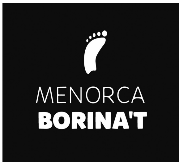
Figura 1 Logotip del programa.

tre inferior als 200 km i una població total de 91.601 habitants 23 ; està dividida administrativament en 8 municipis i geogràficament en petits nuclis de població. Tres administracions públiques gestionen les polítiques de l'illa: Consell Insular de Menorca i ajuntaments gestionen les àrees d'esports, i el Govern Balear, l'àrea de la salut. Tot això condició la gestió dels recursos, els programes d'exercici físic i la pràctica d'activitat física. Els recursos sanitaris de l'illa —nou centres de salut UBS i un Hospital General— depenen de la Conselleria de Salut del Govern Balear. L'únic centre de medicina de l'esport existent pertany al Departament d'Esports, del Consell Insular de Menorca, que compta amb el personal tècnic d'un metge especialista en medicina de l'esport i un llicenciat en ciències de l'activitat física i l'esport.